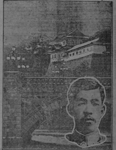
GATE TO PALACE AT TOKIO - EMPEROR YOSHIIHITO