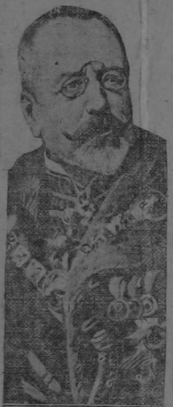
FOREIGN MINISTER BURIAN

El hundimiento del vapor "Acacia" por un submarino con bandera austriaca frente a Bizerta en el Mediterráneo dio un nuevo motivo a los Estados Unidos para establecer diligencias con el Gobierno de Viena, en virtud de haber perecido en el catastrófico algunos ciudadanos norteamericanos que se disponían a regresar a su Patria. El Presidente Wilson envió una nota vigorosa al Embajador Penfield en Viena, nota que tiene en estudio el Ministro de Relaciones Exteriores del Gabinete austríaco Burian, cuyo gravísimo adjuntamos. Las negociaciones están aún pendientes por haberse hecho difícil a Burian obtener la declaración del Comandante del submarino que torpedó el "Acacia".