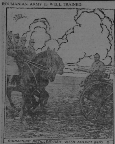
ROUMANIAN ARTILLERYMEN WITH MAXIM GUN