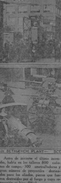
WATCHING FIRE IN BETHLEHEM PLANT—SCENE IN GUN SHOP